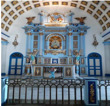
La Virgen de Regla