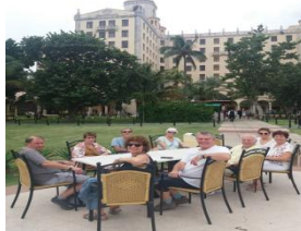
À l'hôtel Nacional