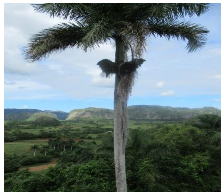
Les Mogotes à Viñales

Nous avons, depuis le Mirador, pu admirer el Valle de los Ingenios, plantations de sucre qui ont fait la richesse de Trinidad entre les XVIIIème et XIX siècle et la maison de plantation de la famille Iznaga. Enfin, nous nous sommes baignés, en plein hiver, dans l'eau à 25 degrés à Playa Ancón, près de Trinidad.