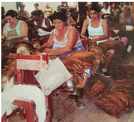
Fábrica de tabacos

Dans les régions sauvages des montagnes de l'Escambray, nous avons vu la végétation endémique. Celle-ci nous avait été expliquée, notamment, au Jardin botanique de La Havane.