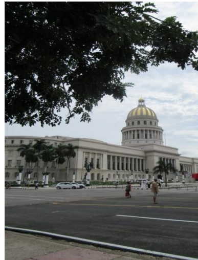
Le Capitolio de La Havane