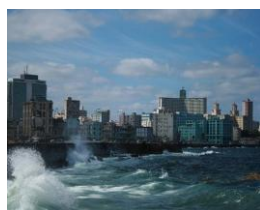
La mer déchainée sur le Malecón