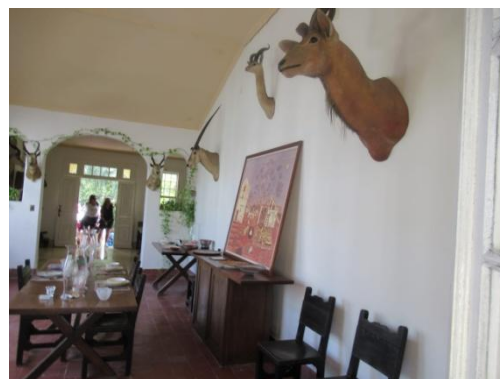
Maison-Musée d'Hemingway (Finca Vigía)

Ce séjour nous a donné l'occasion de déguster la cuisine cubaine, aussi bien dans les restaurants d'Etat que dans les nouveaux restaurants privés, les Paladares, comme à Viñales où nous avons mangé des langoustes. Et lors de notre soirée de « despedida », nous avons dansé avec frénésie pour oublier que nous devons partir.