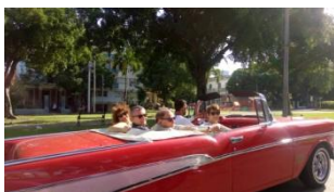
Tour en voitures américaines

L'hiver tropical est doux. Le soir de notre premier jour nous avons dîné au Palco dans la végétation luxuriante, au son de la chanson du Che « Hasta siempre ». Les trois premiers jours ont été consacrés au 500 ème anniversaire de la Fondation de La Havane.