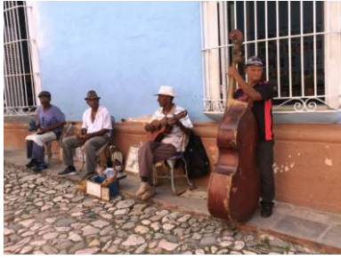
La musique est partout à Trinidad