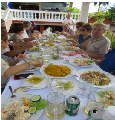
Langouste au Paladar de Viñales

Trinidad, curieusement pétrifiée dans le temps avec ses rues pavées et ses maisons coloniales fait la joie des touristes, en particulier des Français. Elle vient d'être nommée ville créative de l'UNESCO pour son artisanat. Nous étions logés tout près de la grand place et avons pu visiter, prendre l'apéritif, danser à la Canchanchara (bar et apéritif local).