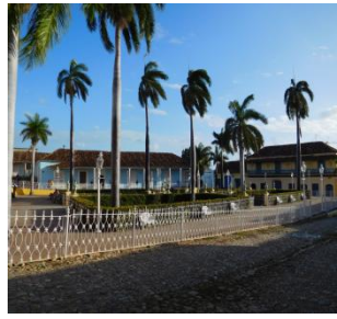
Plaza Mayor (Trinidad)