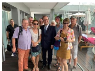
Une partie du groupe avec François Hollande

La visite au Musée de Bellas Artes nous a surpris : des tableaux modernes colorés, créatifs et liés aux mouvements européens et américains, sans réalisme socialiste. Au Musée Hemingway, comme à La Bodeguita, victimes de leur succès, la foule faisait oublier cet homme légendaire, résidant de Cuba pendant une vingtaine d'années, qui a reçu le Prix Nobel pour son roman le Vieil Homme et la Mer, situé à Cojimar, non loin de sa maison « La finca Vigia ».