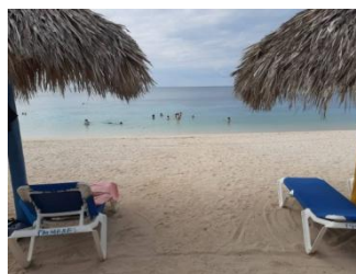
Playa Ancón (Trinidad)