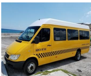
Le minibus de Vladimir

Nous avons vu, bien sûr les contrastes, auxquels nous nous attendions, la vétusté de nombreux immeubles, la difficulté des transports, des charrettes aux bicytaxis, côtoyant les touristes et les grands hôtels. Mais l'ambiance était amicale et chaleureuse, imprégnée de musique.