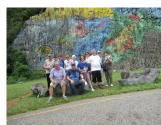
El mural de la Prehistoria (Viñales)