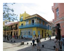
Calle Obispo. La Havane

Après un tour en voitures américaines, nous avons découvert ou redécouvert, pour certains, la vieille Havane, dans ses habits d'apparat, récemment restaurée. Les bâtiments du temps de sa gloire entre la révolution française et 1840, « la grande époque du sucre » avaient fait peau neuve. Le Capitole terminé en 1929, avait retrouvé sa splendeur avec une couche de feuille d'or sur sa coupole et sa statue de la République. C'était aussi l'époque de l'Hôtel Nacional, de la République dite « médiatisée par les Américains ». Les forteresses au lever du jour ou de la nuit, avec leur vue fantastique sur la ville de La Havane, rappelaient, pour leur part, l'époque des pirates attaquant le port où les galions chargés d'or faisaient escale vers l'Europe.