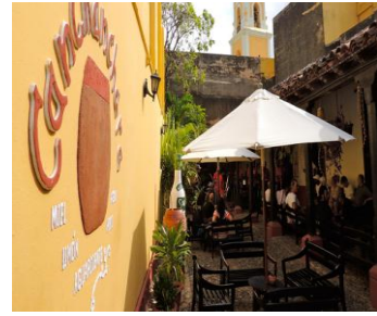
La Canchánchara (Trinidad)