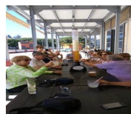
Brasserie du Port de La Havane

De cocktails en cocktails nous avons croisé par hasard, au nouvel Hôtel Manzana de Gómez, qui offre une vue splendide sur le Capitole, l'ancien Président François Hollande et sa suite, venus, comme nous, pour le 500 ème anniversaire. Très surpris de rencontrer des Français, il a accepté de faire des photos avec nous de manière très amicale.